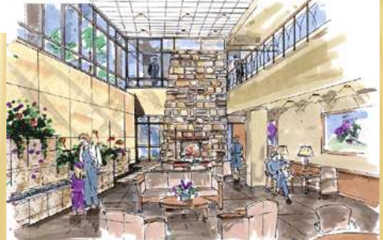
Garden Court Area